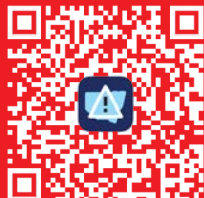
Hazards Near Me